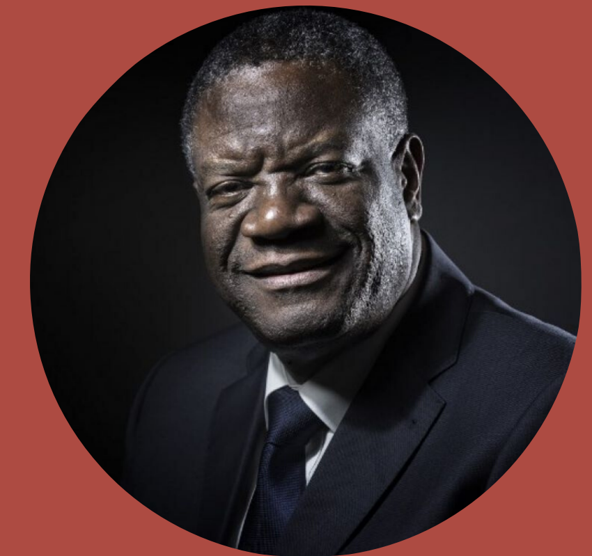
Denis Mukwege Prix Nobel de la Paix 2018

Je remercie par avance celles et ceux qui permettront l'aboutissement de ce projet, que j'approuve et soutiens avec enthousiasme. »